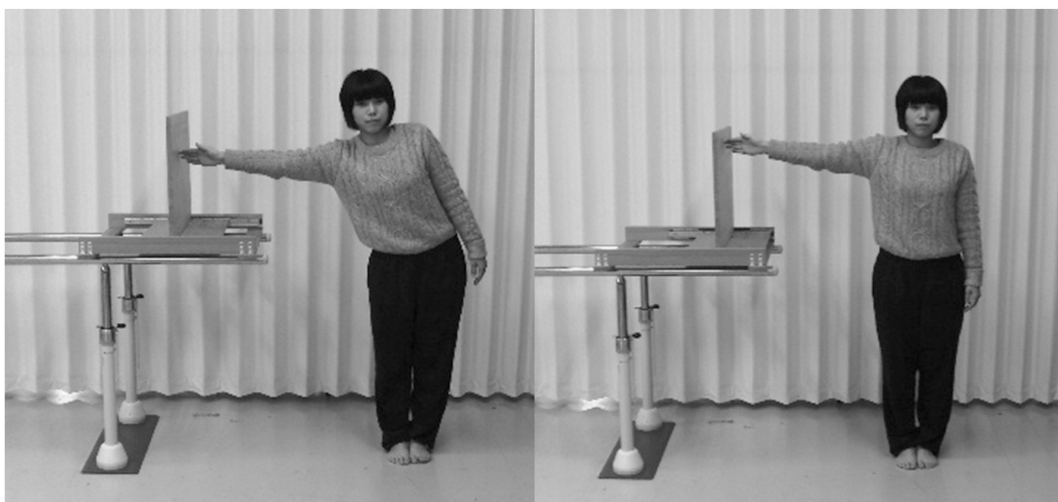
図2 立位での側方リーチ距離の測定