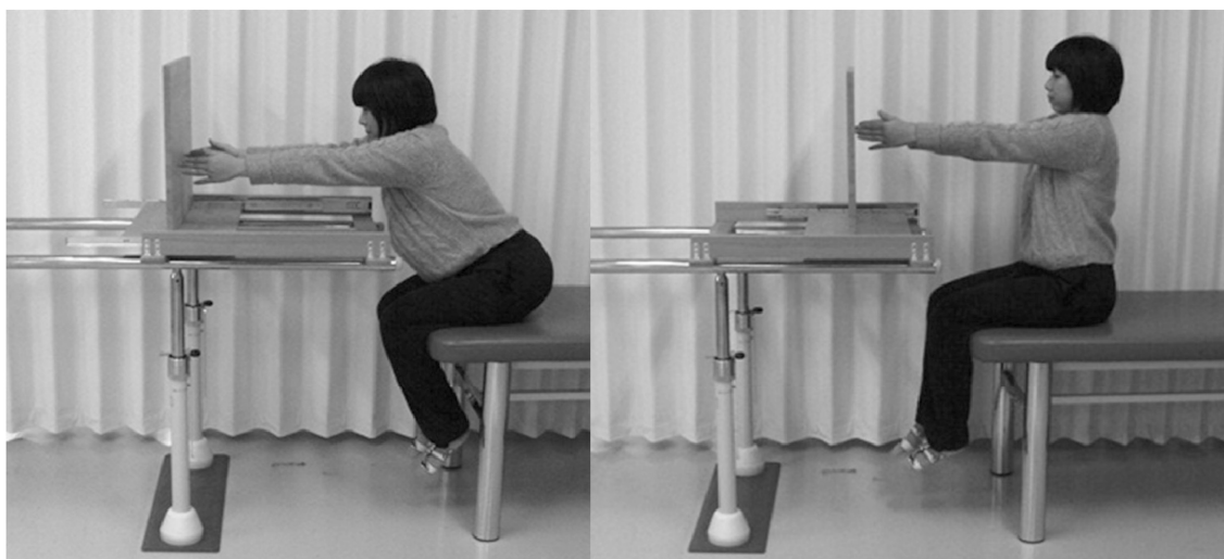
図3 端座位での前方リーチ距離の測定