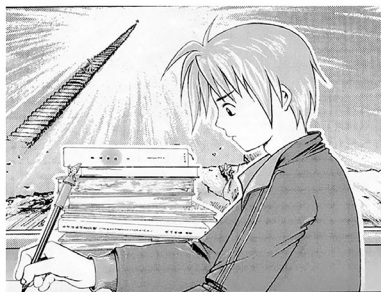
看图作文提示絵図4 『見ることを楽しみ書くことを喜ぶ協同学習の新しいかたち—看图作文レパートリー—』所収 石田ゆき氏作成