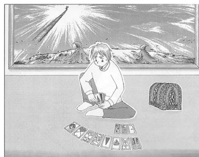
看图作文提示絵図1

『見ることを楽しみ書くことを喜ぶ協同学習の新しいかたち—看图作文レポーター—』所収 石田ゆき氏作成