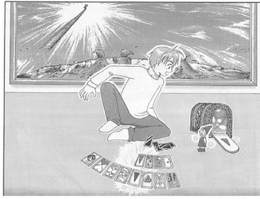
看图作文提示絵図2 『見ることを楽しみ書くことを喜ぶ協同学習の新しいかたち—看图作文レパートリー—』所収 石田ゆき氏作成